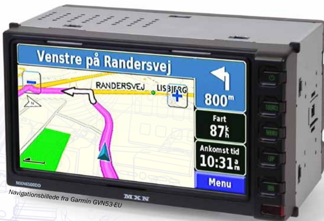
Navigationsbillede fra Garmin GVN53-EU