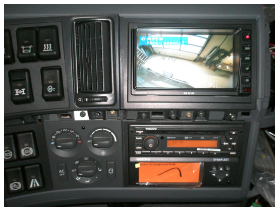
Efter monteringen fremstår monitoren pænt integreret i instrumentbordet med den medfølgende afdækningsramme