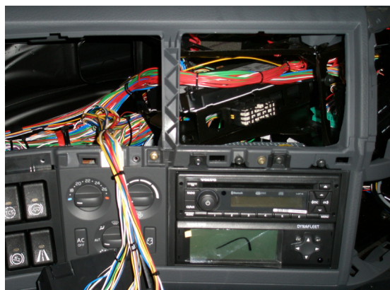
Pladsen i instrumentbordet er meget trang der hvor MXN monitoren skal installeres.