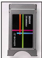
CA-modul. Set med forsiden opad

Denne vejledning gælder kun for INVATEC M19-DVD4.