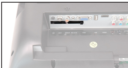
Placering af CI-slot (Card Interface) på bagsiden af INVATEC M19-DVD4.