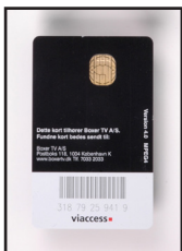
Betalingskort set med chipsiden opad!